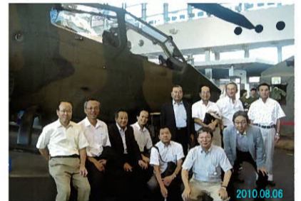
(ロジ研 渋谷副支部長)

政府の事業仕分の対象になって興味もありました。映像や説明で自衛隊の活動を懇切丁寧に教えていただき国内外での救助活動やPKOにいかに関与しているのかを改めて知りました。また屋内や屋外には活動に使われた戦車やヘリコプター等も展示されており充実した研修会でした。